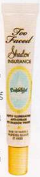
Shadow Insurance Candlelight Softly Illuminating Eye Shadow Primer จากไพรเมอร์เนื้อเบสท์เนื้อละเอียดเพิ่มประกายแวววาวให้สีอายแชโดว์ (1,090 บาท) จาก TOO FACED