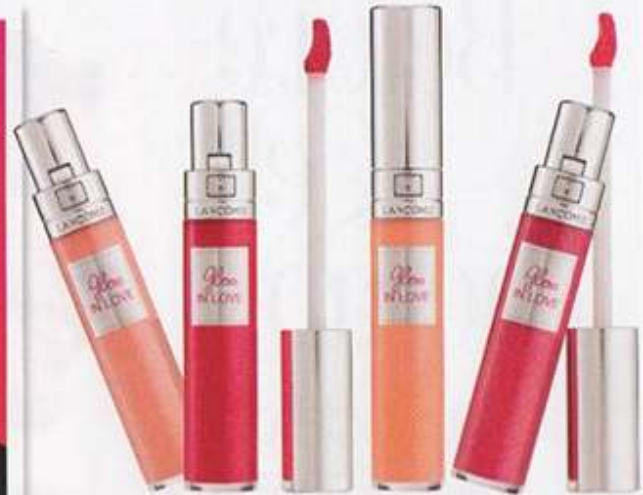
Lancôme Gloss In Love 990 บาท ลิปกอสสพาทกแดดเนื้อสัมผัสเนียนจนประกายวันวานจนลืมปาก